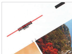
Lecteur de code-barres avec plug-in compatible Adobe AI/ID.