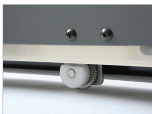
Unité de perforation transversale, complète ou partielle.