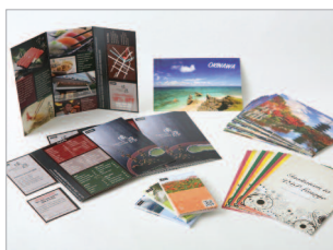
Réalisez des cartes de visite, cartes de vœux, photos, flyers, etc...