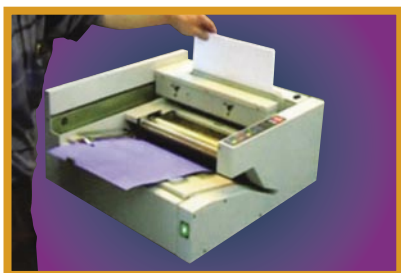
Mettre les feuilles dans le chariot